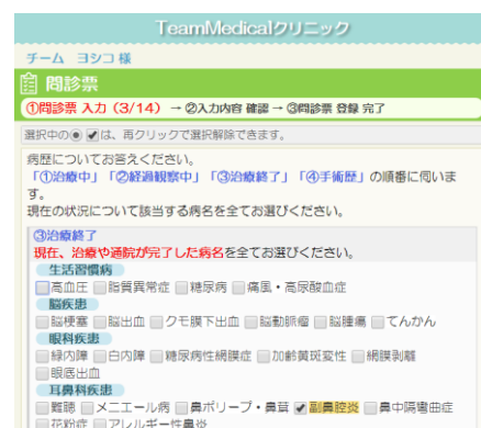
<WEB 問診画面イメージ>

外来にはタブレット端末を活用した問診システムを、健診には WEB 事前回答を導入。忙しい方でも来院しやすいよう、スマホ診察券を利用した自動受付や WEB 予約システムも採用します。