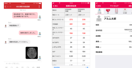
<Join 使用画面> <MySOS 使用画面>

健康診断結果を管理できるスマートフォンアプリ「MySOS」を外来・健診両方に導入することで、来院者は健康診断結果や服薬履歴をスマホで確認できます。また、アルムと東京慈恵会医科大学附属病院の共同研究により開発され、薬機法における医療機器プログラムとして認証された、医療関係者間コミュニケーションアプリ「Join」も活用。慈恵医大と連携することで、オフィス街のクリニックでありながら大学病院の専門医による高度な診断を受けることができます。